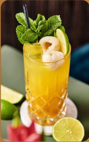
TROPICAL CHILL - 6 € Limette, Mango, Maracuja, Litschi