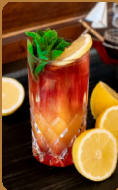
HIBISCUS PASSION - 6 € Hibiskus & Maracujasaft