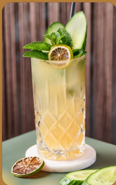
GINGER BLISS - 4 € Limette, Apfel, Holunder Ginger Ale & Gurke