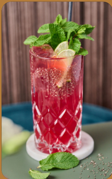
LIMEBERRY FIZZ - 4 € Limette, Holunder, Sodawasser Cranberry & Chiasamen