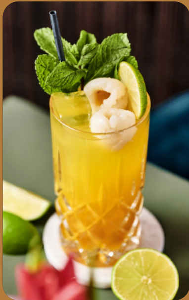
TROPICAL CHILL - 6 € Limette, Mango, Maracuja, Litschi