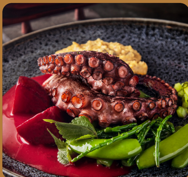
#BITEOFTHEWEEK: PURPLE PULPO - 29 € Gegrillter Pulpo. Beilagen: Glasierte Beete, Meeresspargel, Bohnen, eingelegte Minz-Gurken, Trüffel-Kartoffel-Püree. Sauce: Rote Beete Kokos Curry