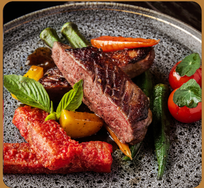
#BITEOFTHEWEEK: MADAME BARBARIE - 28 € Barbarie Entenbrust. Beilagen: Okrabohnen, gelber Rettich, Babymöhren, Cherrytomaten, knuspriger Tarokuchen Sauce: Hochland-Pfeffersauce