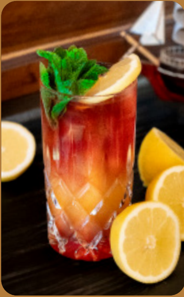
HIBISKUS PASSION - 6 € Hibiskus, Maracujasaft