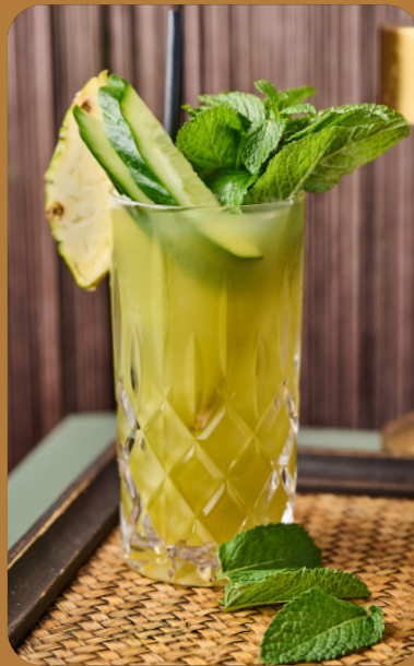
CRAVE WAVE - 6 € Ananas, Gurke, Minze, Soda